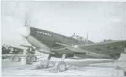
W kablinie niezidentyfikowanego Spitfire „biała 77” z numerem „385” widoczna na drugim planie; Peshawar, listopad 1945 r.