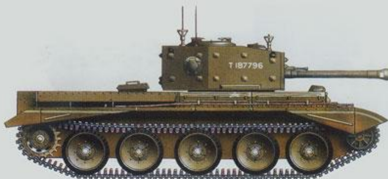
Британский танк "Кромвель IV", использовавшийся в качестве командирской машины в группе D, скорее всего в 5-м конноартиллерийском полку королевской механизированной артиллерии 7-й танковой дивизии "Крысы пустыни". Нормандия, район н/п Виллер-Бокаж, июнь 1944 года.