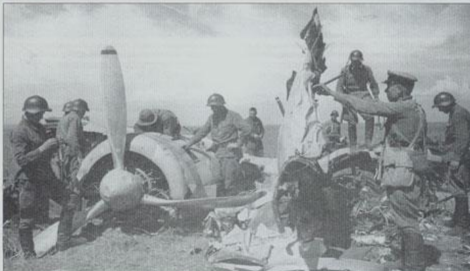
Обломки сбитого бомбардировщика Ки-27 советские фотокорреспонденты не раз использовали в качестве живописных «декораций» для съемок.

20 августа, после долгой и тщательной подготовки советско-монгольские войска начали наступательную операцию по окружению и уничтожению японской группировки на восточном берегу Хайластын-Гол.