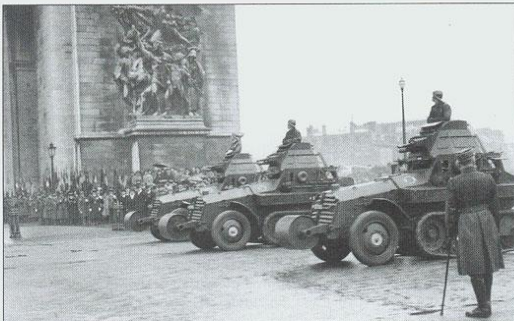
Francuskie samochody pancerne Schneider AMC 29 (P 16) podczas defilady w Paryżu, 11 listopada 1936 roku. French Schneider AMC 29 (P 16) armoured cars parading in Paris, November 11, 1936. [ADM]