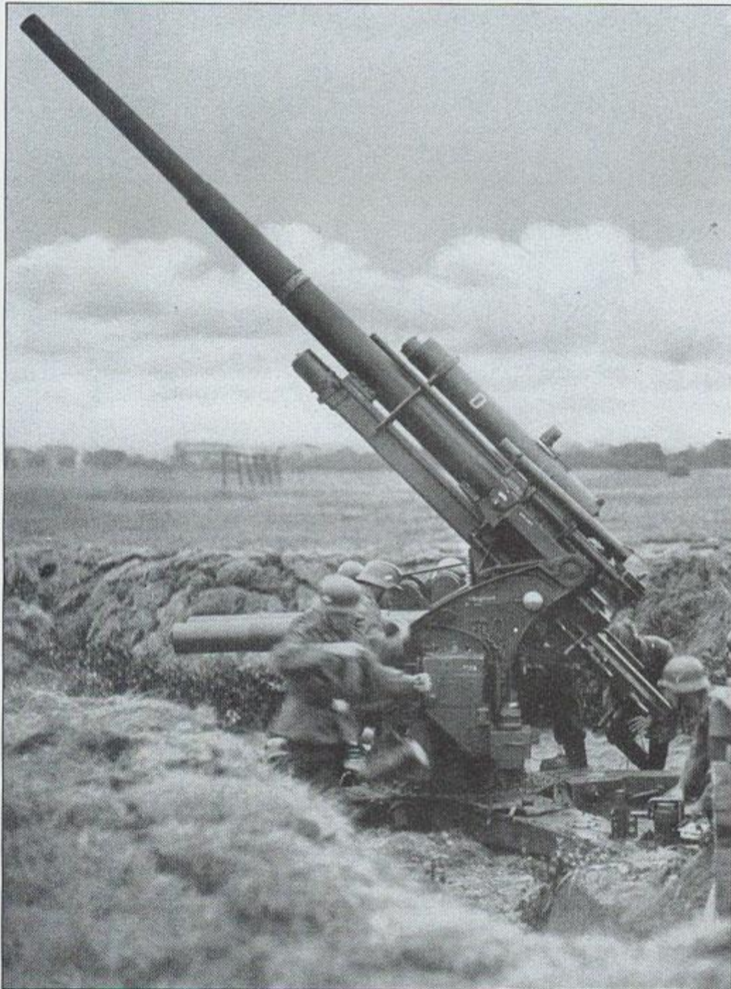
Armata przeciwlotnicza 8,8 cm Flak 18 kalibru 88 mm. Armaty tego typu były z powodzeniem używane m.in. do zwalczania francuskich czołgów Char B1bis. German 8.8cm Flak 18 88mm AA gun being used in its anti-tank role against French Char B1bis tank.