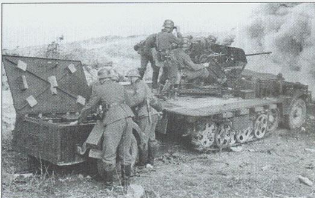
Obsługa dział samobieżnego Sd Kfz 10/4 ostrzeliwuje pozycje francuskie, Francja, maj 1940 roku. The crew of the Sd Kfz 10/4 SP gun firing French positions, France, May 1940.

niewoli. Niemieckich piechurów z opresji uratowały dopiero obsługi dział przeciwlotniczych kalibru 88 milimetrów. Tym razem byli to żołnierze z I. Baterii 64. Flak Abteilung , którzy mieli swoje stanowiska na, znajdującym się na południowy zachód od Abbeville, wzgórzu Caubert. Precyzyjnym ogniem rozbili kilkanaście czołgów. To wydarzenie osłabiło animusz rozgrzanych walką francuskich czołgistów. Kierowcy wielu wozów bojowych wrzucili wsteczny bieg i zawrócili w stronę własnych pozycji. Pozbawiona osłony pojazdów pancernych francuska piechota zaległa pod silnym ogniem karabinów maszynowych i moździerzy. Rosły straty. Po kilkunastu godzinach bezproduktywnego „dreptania w miejscu” piechurzy również cofnęli się w stronę własnych linii.