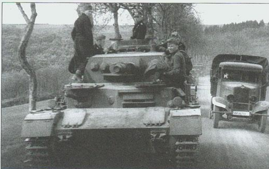
Czołg PzKpfw IV Ausf. D z 2. Pułku Pancernego 2. Dywizji Pancerniej w marszu przez Ardeny, 10 maja 1940 roku. A PzKpfw IV Ausf. D tank from the 2nd Panzer Regiment 2nd Panzer Division in Ardenes, May 10, 1940.

W maju 1940 roku armia niemiecka zaatakowała Francję, Belgię i Holandię. Wśród nacierających wojsk główny wysiłek bojowy wniosły, podobnie jak we wrześniu 1939 roku w Polsce, jednostki pancerne. W odróżnieniu jednak od kampanii wrześniowej przeciwnicy Niemców rzucili do walki również spore ilości czołgów. Książka przedstawia historię działań niemieckich, francuskich oraz brytyjskich jednostek pancernych na zachodzie Europy w 1940 roku.