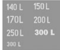
Oznaczenia pojemności zbiorników paliwa Fuel tank capacity