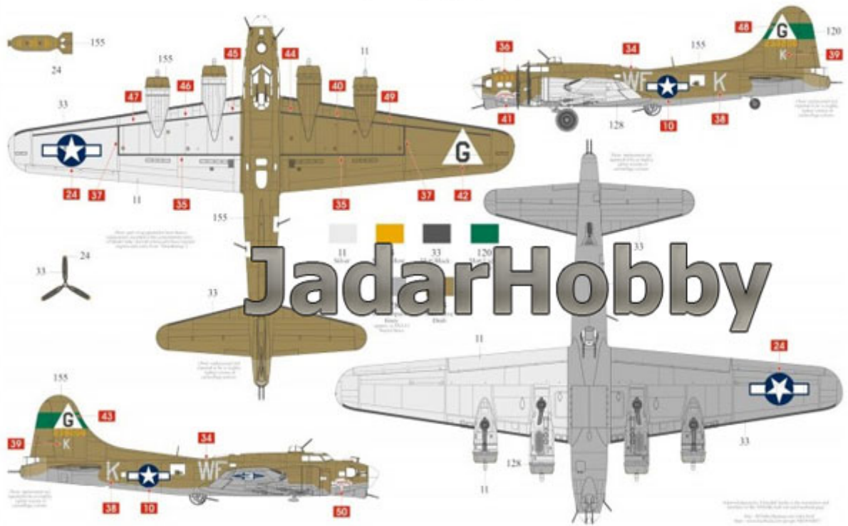
Boeing (Douglas built) B17G-35-DL Flying Fortress™ 42-38206 "Thundermug", 364th Bomb Squadron, 305th Bombardment Group, Royal Air Force Chelveston, Northamptonshire, England, 1944.